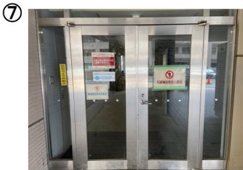
⑦ 医系研究棟1号館の入口です。