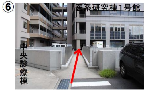
⑥ この通路を渡って下さい。(正面の建物が医系研究棟1号館です)