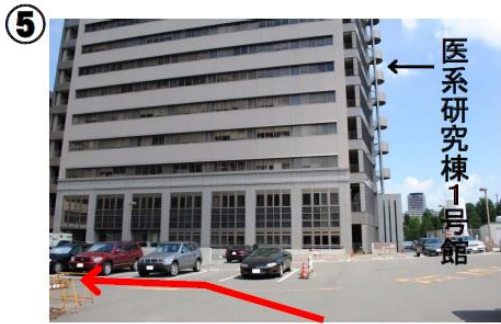
⑤ 病棟に沿って手前の駐車場を中央診療棟に向かってお進み下さい。